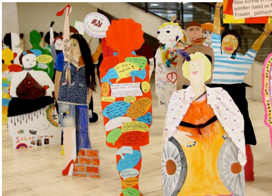
Aktion „Stand up! Misch dich ein - Mädchen zeigen Meinung“, Stuttgarter Landtag, 12.10.2016

AG Mädchen in der Jugendhilfe | KJHA 24. November 2016